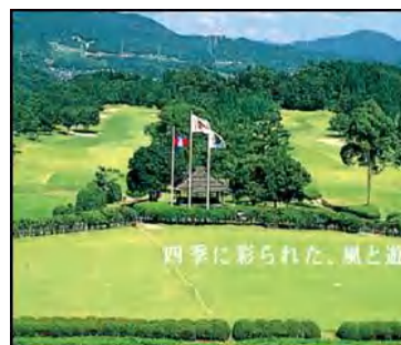
太宰府ゴルフ倶楽部