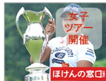
女子ツアー開催コース