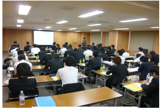
セミナー会場風景