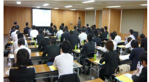
セミナー風景(2012年4月)