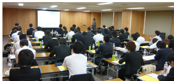
セミナー会場風景