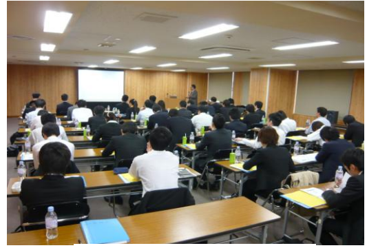
セミナー会場風景