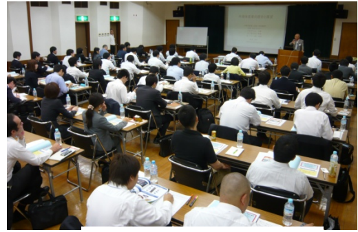
セミナー会場風景